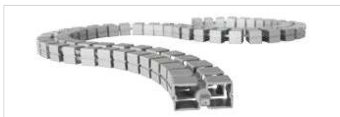
KUBA Kabelführung KUBA Cable guide

Die vertikal verlaufende Kabelführung KUBA wird mit diversen Tischanbindungsmöglichkeiten, Kabeldurchführungen, Adaptern und Magnethaltern auf Ihre Anwendung zugeschnitten.