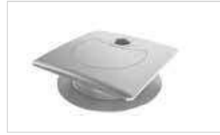
OL-Lock 80 OL-Lock 80