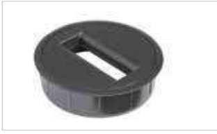
KDW (rund) KDW (round)