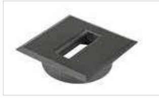
KDL (eckig) KDL (square)