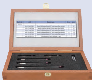
Kit stylets M3 CRP 2