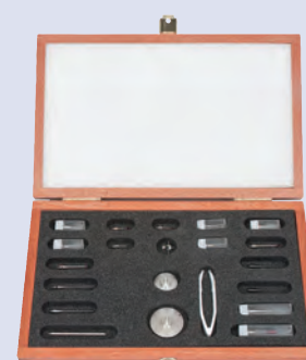
Kit stylets M2 Expansion