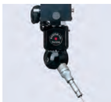
PH10M Tête orientable pilotée en CN