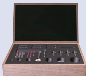
Kit stylets M2 Professionnel