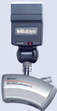
Capteur laser : SurfaceMeasure