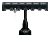
MCR20 Changeur pour TP20