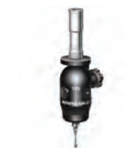
TP8 Palpeur indexable manuellement