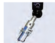
Palpeur micro format UMAP-MMT ø0,1 et 0,3