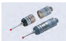
TP20 Modèle compact