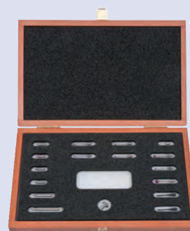
Kit stylets M2 Addition