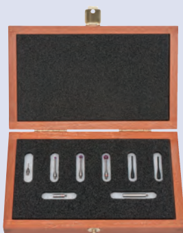
Kit stylets M2 Starter