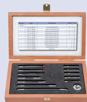
Kit stylets M2 Basique 2