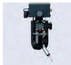
MIH Orientable manuellement