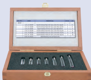
Kit stylets M3 CRP 1