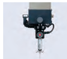
PH6 Tête fixe