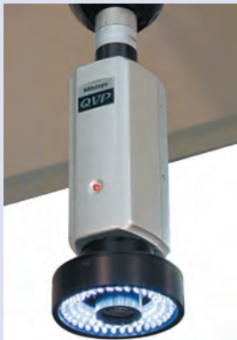
Capteur optique : QVP (Quick Vision Probe)