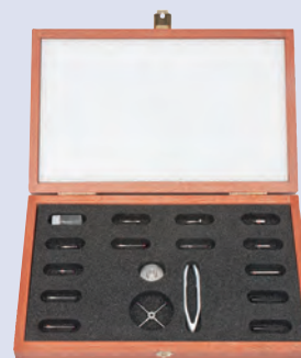
Kit stylets M2 Basique 1