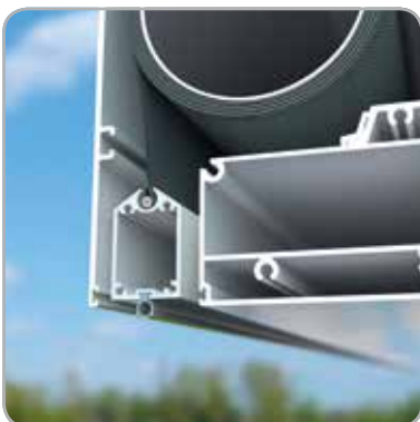
Geïntegreerde zonwering: onderlat verdwijnt in de kast