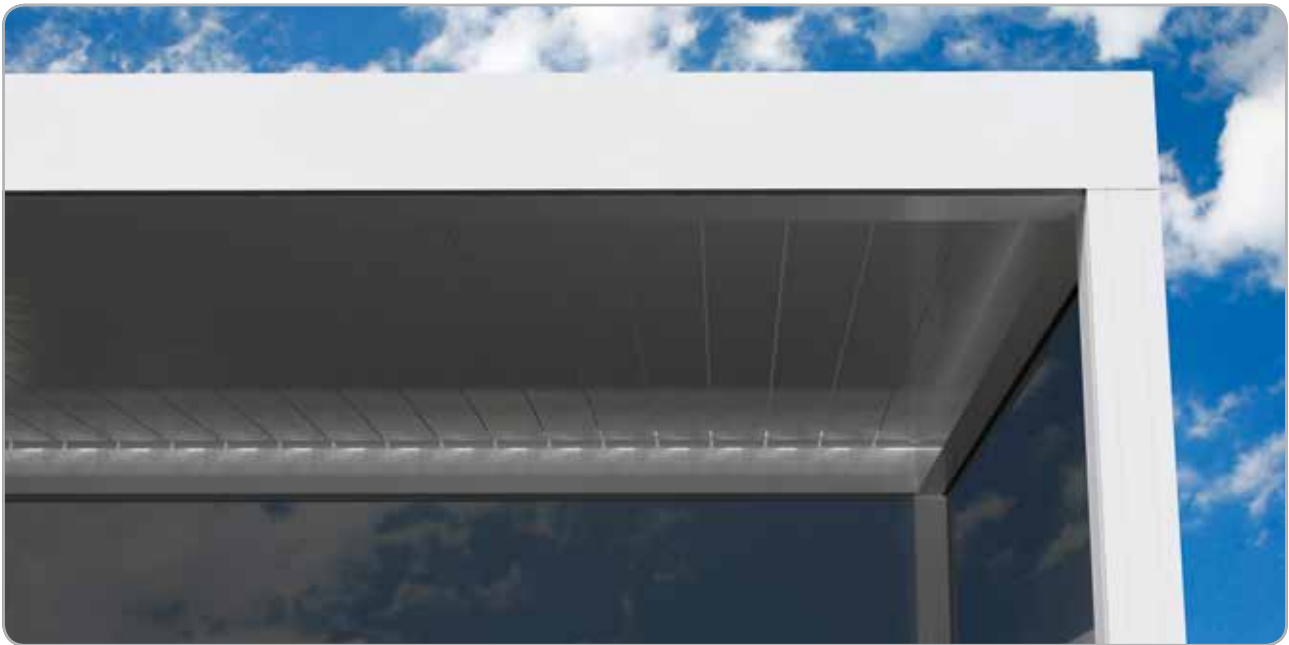
In gesloten positie: waterdichte lamellen met een mooi egale en vlakke onderzijde