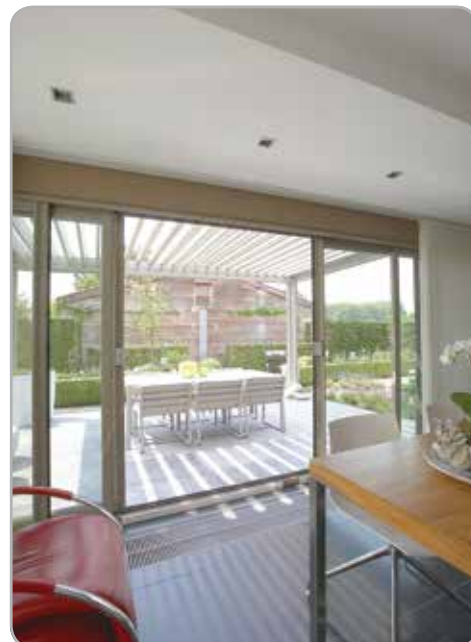
Geïntegreerde verticale windvaste zonwering door middel van Fixscreen®-technologie