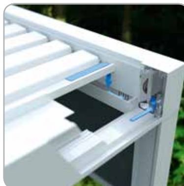
Efficiënte geïntegreerde waterafvoer