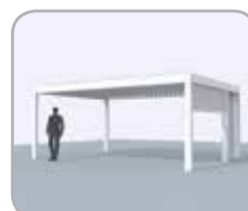
Pivot- en/of spanzijde voorzien van geïntegreerde Fixscreen® en schuifdeur dmv Loggiascreen® 4FIX of Loggiawood®