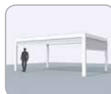
Combinatie van meerdere geïntegreerde Fixscreen®