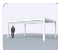
Pivotzijde voorzien van geïntegreerde Fixscreen®

Deze uitbreidingen zijn ook achteraf perfect integreerbaar.