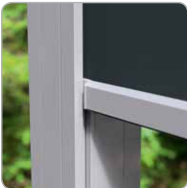
Geïntegreerde zijgeleiders + Fixscreen® in kolom