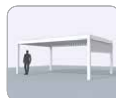
Spanzijde voorzien van geïntegreerde Fixscreen®