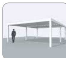
2-delig koppelbaar aan pivot- of spanzijde