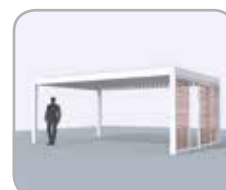
Spanzijde voorzien van Loggiawood® of Loggiascreen® 4FIX