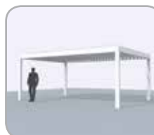
Vrijstaand (4 kolommen)