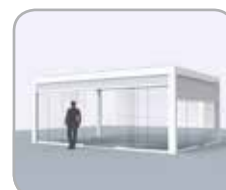
Pivot- en/of spanzijde voorzien van glazen schuifwanden al of niet in combinatie met geïntegreerde Fixscreen®